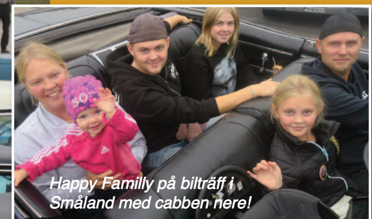
Happy Family på bilträff i Småland med cabben nere!