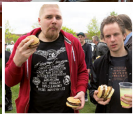
En eller två rejäla Texas Powerburgare med alla tillbehör är vad Socialstyrelsen rekommenderar till frukost i Nossebro...