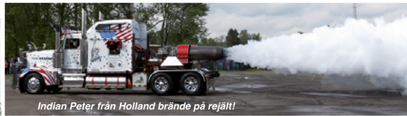
Indian Peter från Holland brände på rejält!