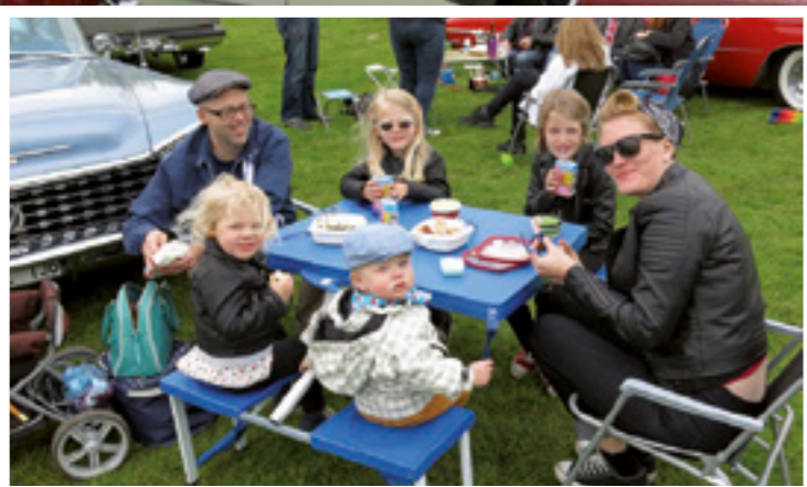
Till AmericaFesten tar man med sig hela familjen. Dom små "raggarna" måste skolas in rätt från början...